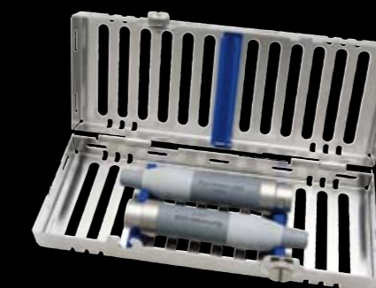
1/4 DIN Symmetry IQ handinstrumentkassett – dubbel (IM14DINHP8 - bilden). Symmetry IQ handinstrumentkassett – enkel (IM30IQ8 - Ej DIN format.)